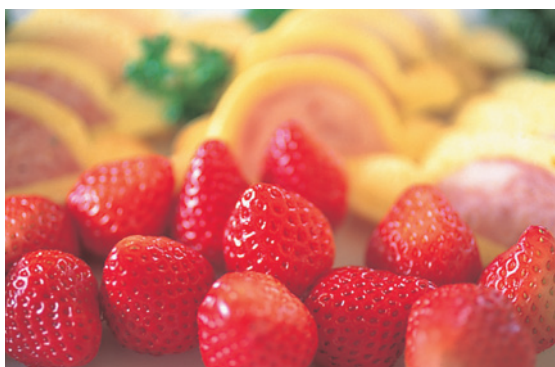
このカレンダーの使用紙は、菊判76.5Kgです。

規格: 四六判 YH 90Kg 110Kg 135Kg 180Kg 220Kg 菊判T・YH 62.5Kg 76.5Kg 93.5Kg 125Kg 153Kg