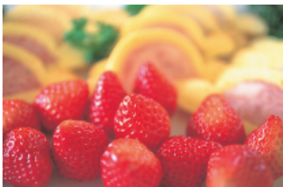
このカレンダーの使用紙は、四六判90kg、ナチュラルです。

規格:四六判Y目 70kg 100kg 130kg 170kg 50色 製造元:特種東海製紙株式会社